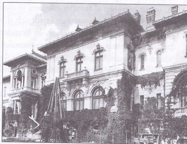
Palatul Cotroceni la 1900

Curtea Regală era condusă de Mareșalul Curții cu rang de înalt demnitar, a cărui principală misiune era de a reprezenta instituția pe care o conducea pe lângă autoritățile publice, inclusiv ambasade. Fiind și purtător de cuvânt al Palatului, Mareșalul Curții Regale îl reprezenta pe rege cu ocazia unor festivități și putea semna unele documente, care nu