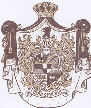
Stema familiei Hohenzollern-Sigmaringen

Castelul familiei Sigmaringen, care aparține acestei ramuri din secolul al XVI-lea, a suferit numeroase transformări mai ales după Războiul de