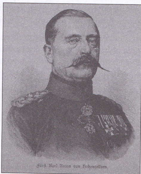
Karl Anton de Hohenzollern (1811-1885)