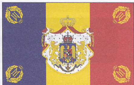
Steagul regal al României

pentru regină, principele moștenitor și ceilalți membri ai familiei regale. Cifra regală, ultimul dintre însemnele regale, era diferită de la un monarh la altul. Acest însemn a fost folosit de suveranii României pentru a marca obiectele care aparțineau regelui sau casei sale. Cifra regală era aplicată pe cărți, scrisori, pe drapele sau uniforme și era formată din inițiala stilizată a numelui regelui. De cele mai multe ori, cifra regală era însoțită, în partea de sus a sa, de simbolul Coroanei.