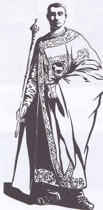
Frederic I de Zollern

Conții Zollern, din care se trag Hohenzollernii, făceau parte din una din cele mai vechi familii germane, amintită documentar în Suabia, la începutul secolului al XI-lea. În anul 1061 sunt amintiți doi conți de Zollern, Wezel și Burchard. Dacă familia celui dintâi s-a stins peste un veac, spița celui de-al doilea se va perpetua în timp. La sfârșitul secolului al XII-lea și începutul secolului al XIII-lea, Frederic al II-lea și Conrad I, fii lui