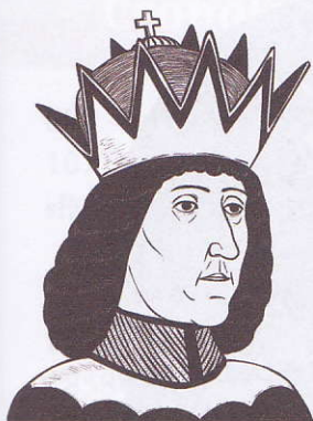
Frederic II de Zollern