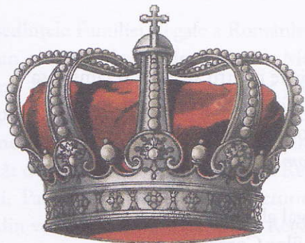
Coroana de oțel a Regelui Carol I