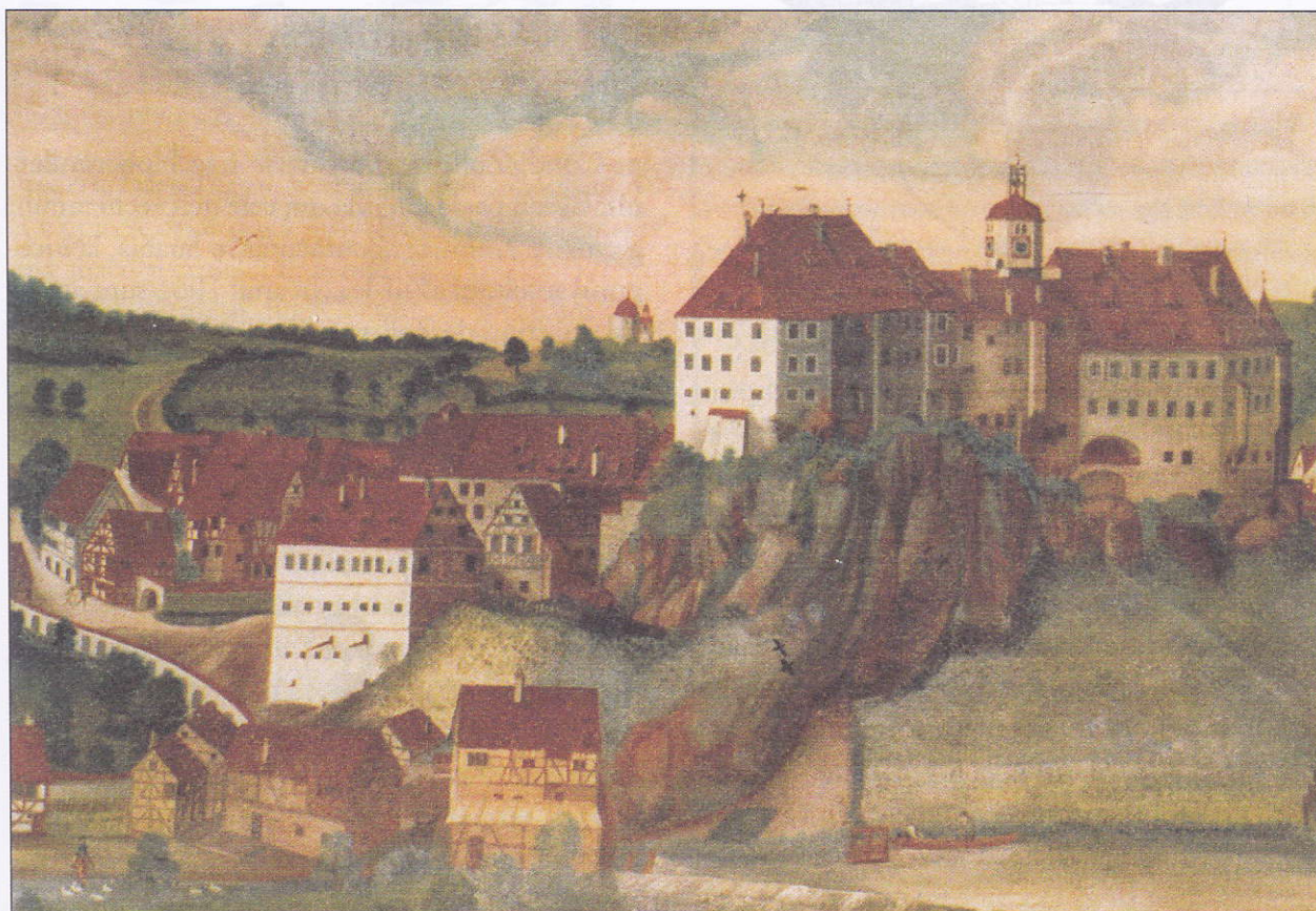
Castelul și orașul Sigmaringen, tablou din 1750