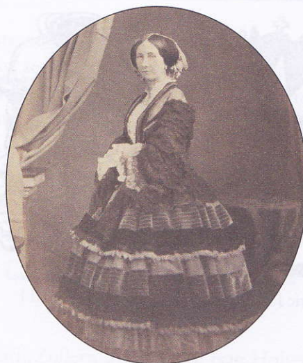
Josephine von Baden (1813-1900)

încăperilor existente cât și prin adăugarea unor săli de bal, a Casei Artelor, a turnului de apă, a unor terase, până atunci inexistente. La 17 aprilie 1893, un incendiu va pârjoli o parte a castelului, dar, în anii următori, se va restaura partea castelului care suferise în urma focului.